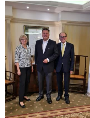
Gäste im Berlin Capital Club