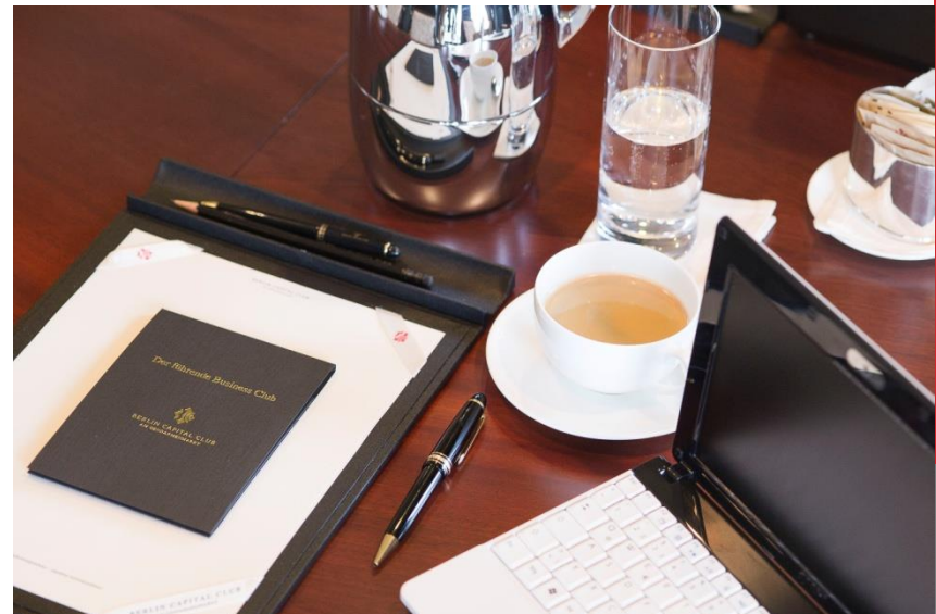
Einblick in den Berlin Capital Club