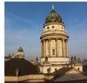
„Menschen, die wir am liebsten lieben wollen!“